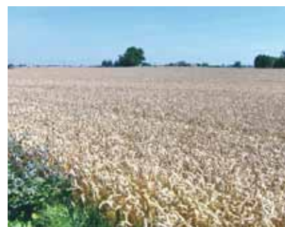
En sten i sågspånstegel väger mellan 30 och 40 procent mindre än en traditionell tegelsten.

Tegelbruken återvinner processvattnet så att naturen och intilliggande vattendrag inte skadas av lerpartiklar som kan finnas i vattnet.