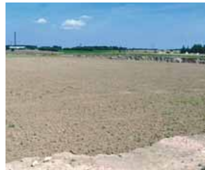
Det översta jordlagret och leran schaktas bort och efter brytningen fylls marken ut med matjord så att området kan användas som tidigare.

På den danska marknaden motsvarar sågspånsteglet mer än hälften av allt tegel som används i bakmurar eller innerväggar.